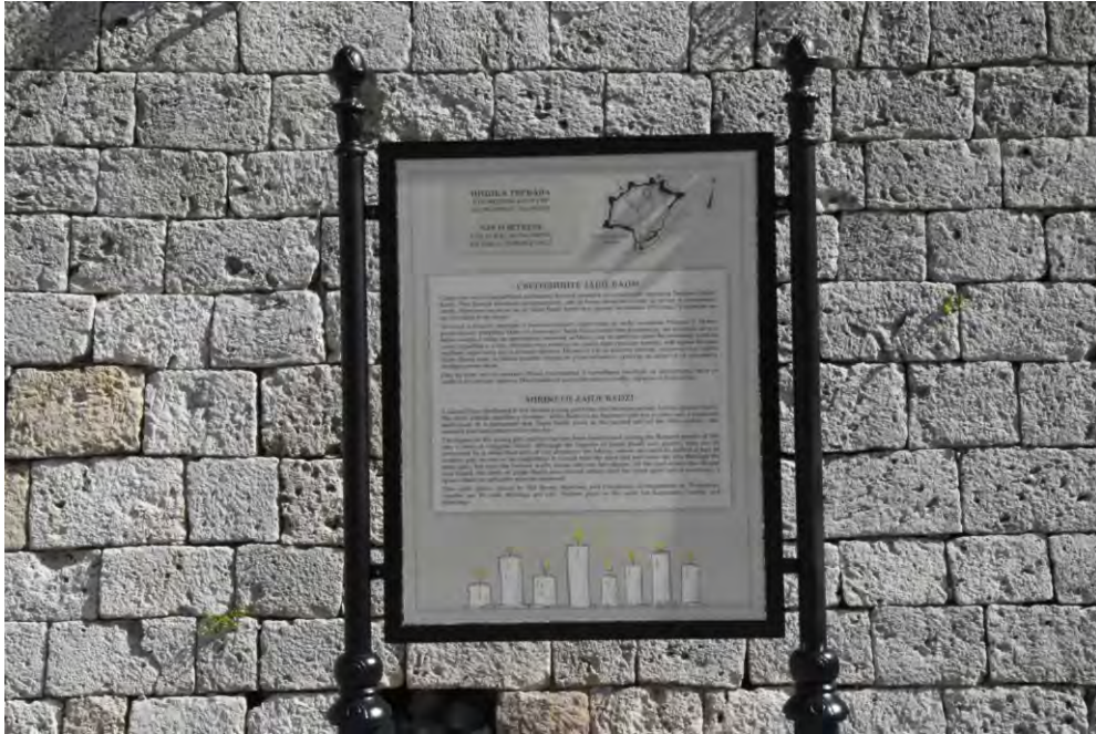
Слика 10. Информативна табла (Анђела Пејдо)