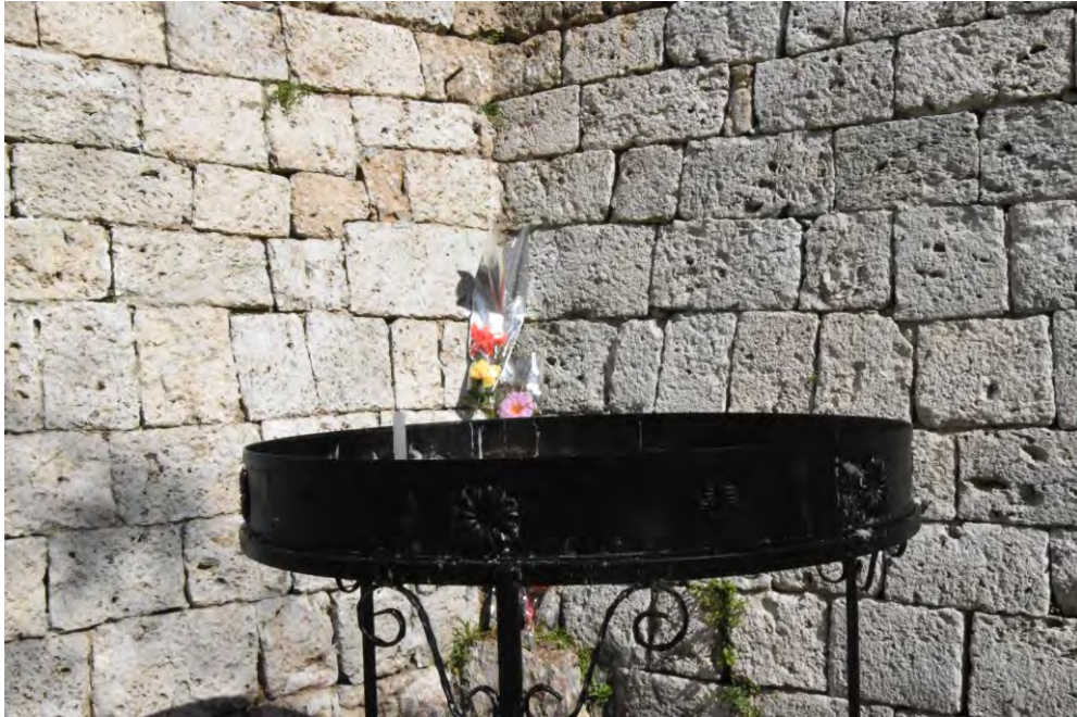
Слика 12. Сталак за свеће (Анђела Пејдо)