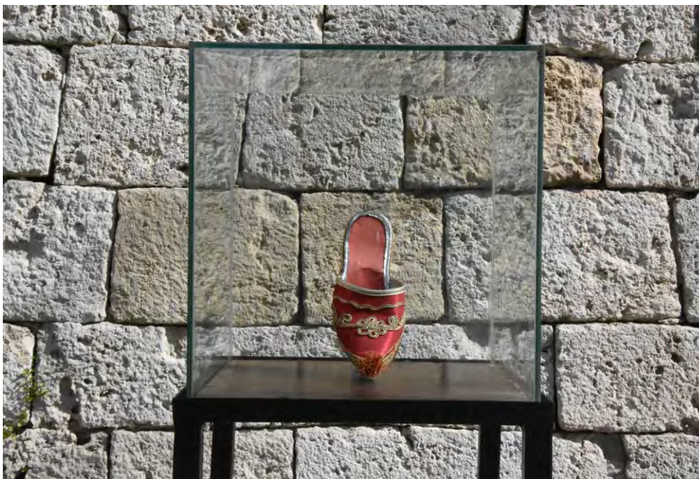
Слика 13. Нанула у стакленој витрини (Анђела Пејдо)