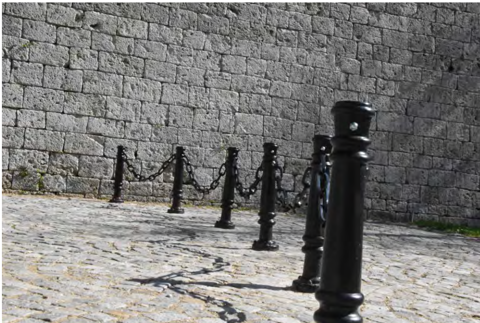
Слика 11. Ограда око ромског култног места (Анђела Пејдо)