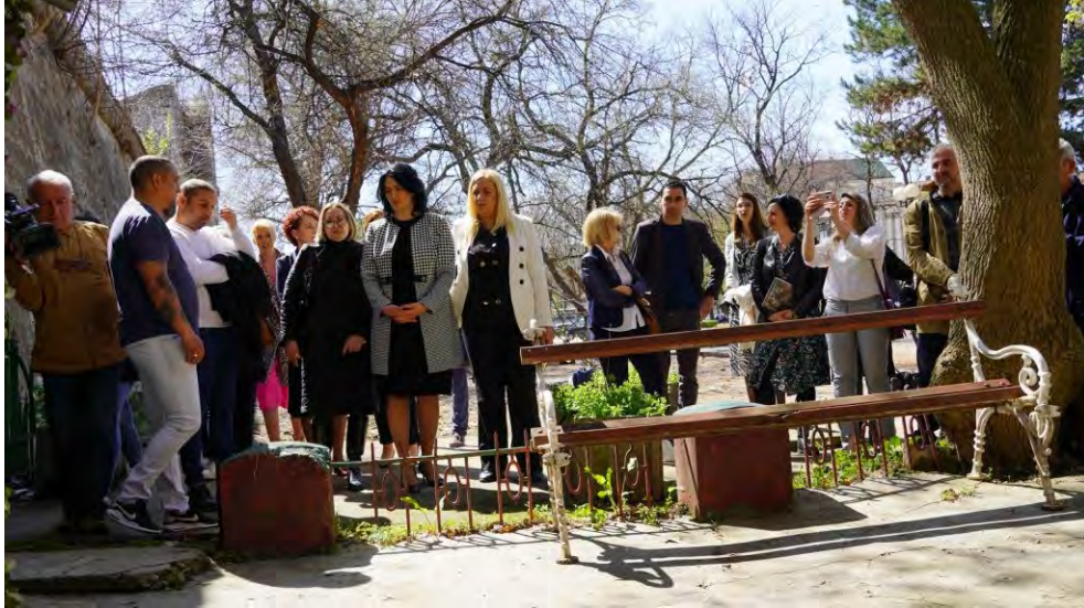
Слика 8. Градски челници у посети ромском култном месту 8. априла 2022. г.