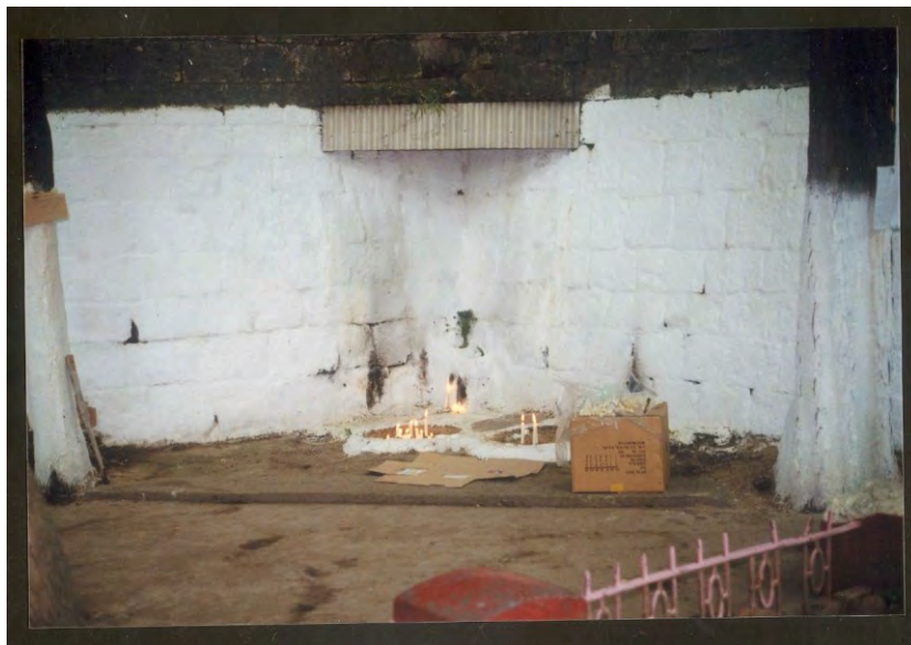
Слика 3. Изглед ромског култног места 2001. године (Драган Тодоровић)