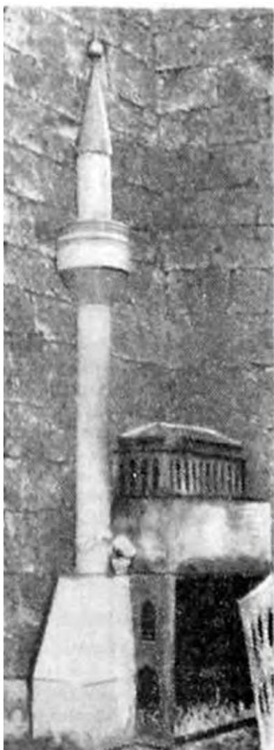
Слика 1. Џамија са минаретом поред ромског култног места („Време“, бр. 5452 од 20. марта 1937. године, стр. 7)