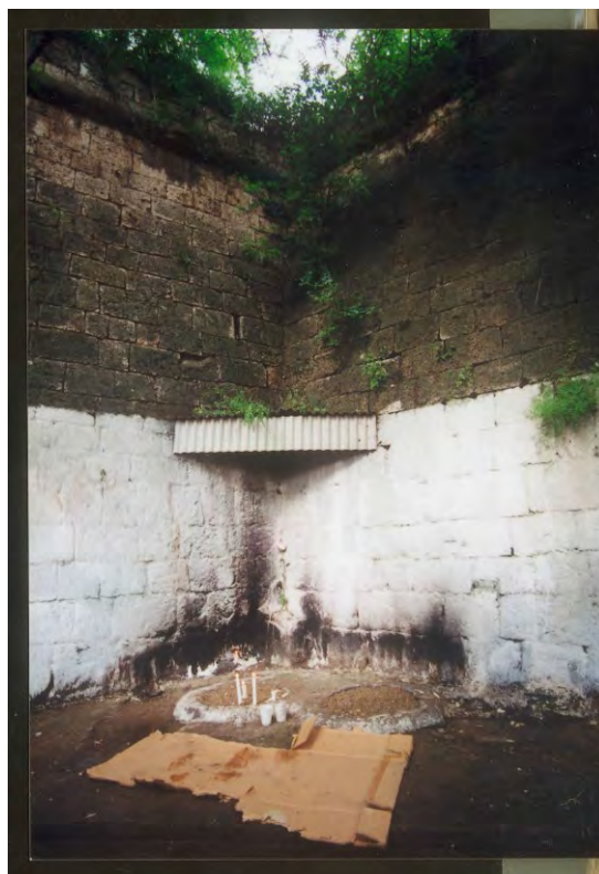
Слика 4. Изглед ромског култног места 2001. године (Драган Тодоровић)