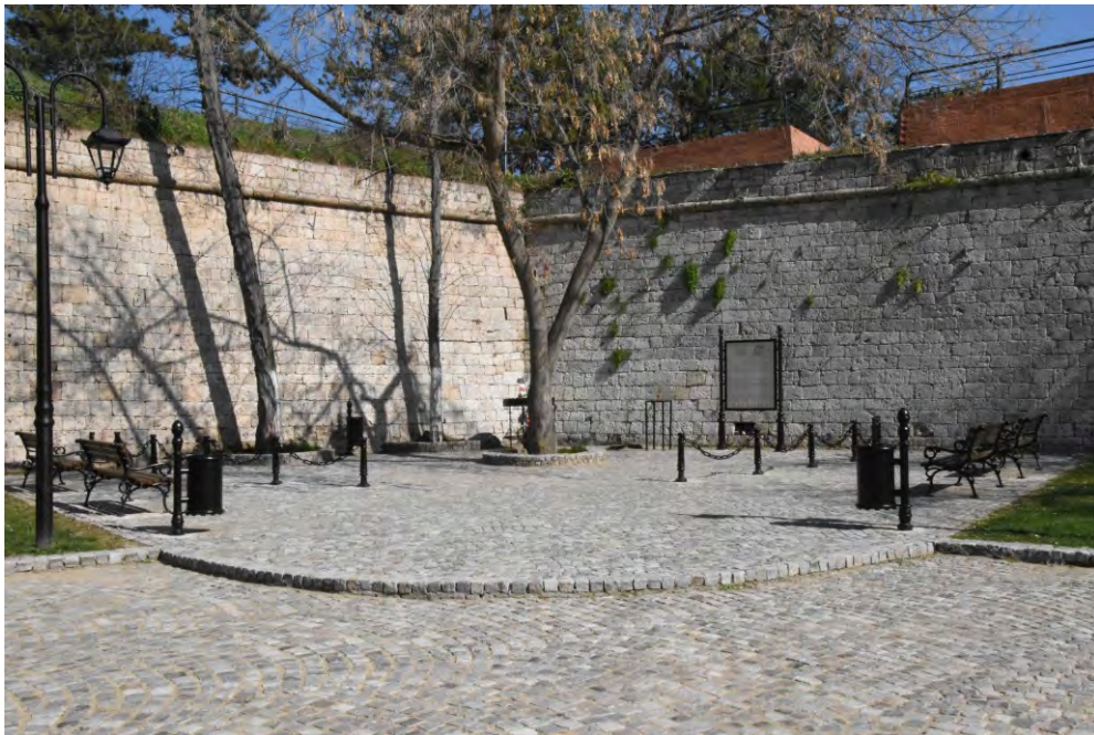
Слика 9. Данашњи изглед ромског култног места (Анђела Пејдо)