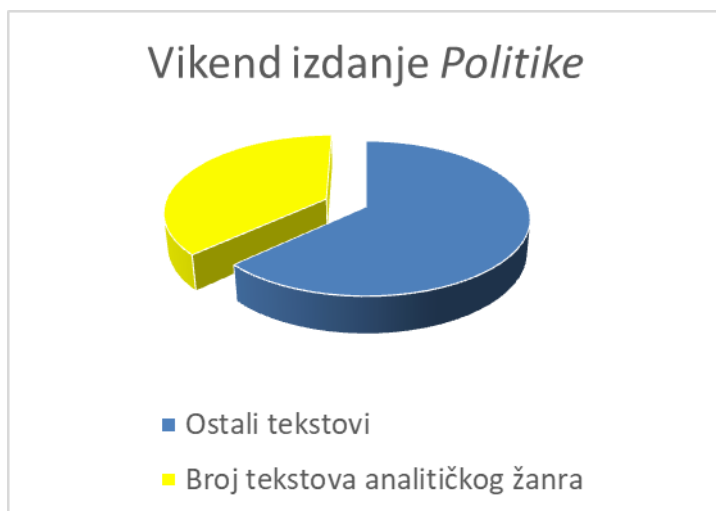
Grafikon 3. Grafički prikaz zastupljenosti analitičkih žanrova u Danasu