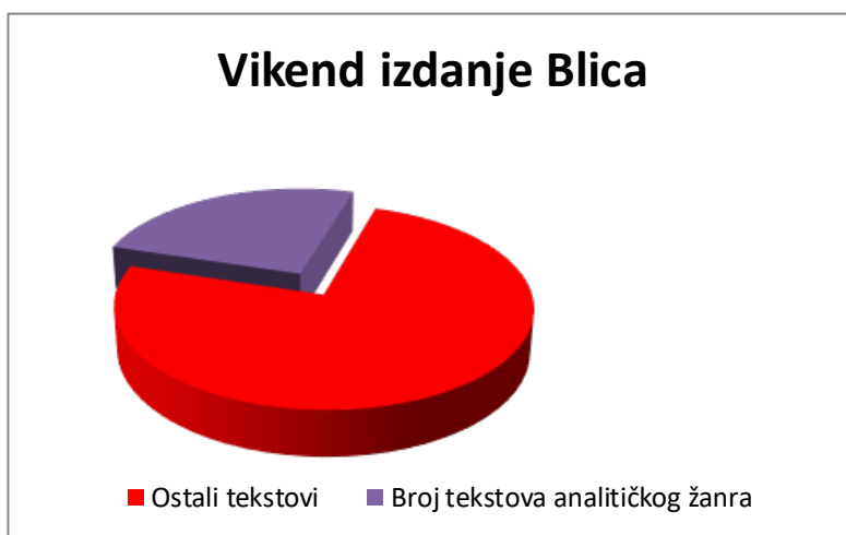
Grafikon 1. Grafički prikaz zastupljenosti analitičkih žanrova u Blicu

Broj analitičkih tekstova u vikend izdanju ovog dnevnog lista izražen procentualno iznosi 24,4%.