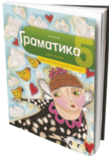
Слика 2 Уџбеник за пети разред основне школе издавачке куће Логос