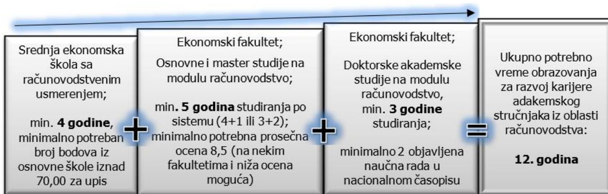
Slika 1. Optimalni obrazac obrazovanja za razvoj karijere akademskog stručnjaka iz oblasti računovodstva

Sumirajući prethodno možemo skicirati formalni optimalni obrazac obrazovanja za razvoj karijere u oblasti akademskog napredovanja kada je u pitanju računovodstvo. Ono što je bitno napomenuti jeste da budući akademski stručnjak iz oblasti računovodstva treba obratiti pažnju na prosečnu ocenu tokom studiranja i kvalitetan naučno istraživački opus koji tangira tematiku računovodstva. Prednost akademskog usavršavanja iz oblasti računovodstva jeste što je pojedinac sa završenim doktorskim studijama „dualno obrazovan“, bez dodatnog iskustva relativno lako se angažuje na novo radno mesto.