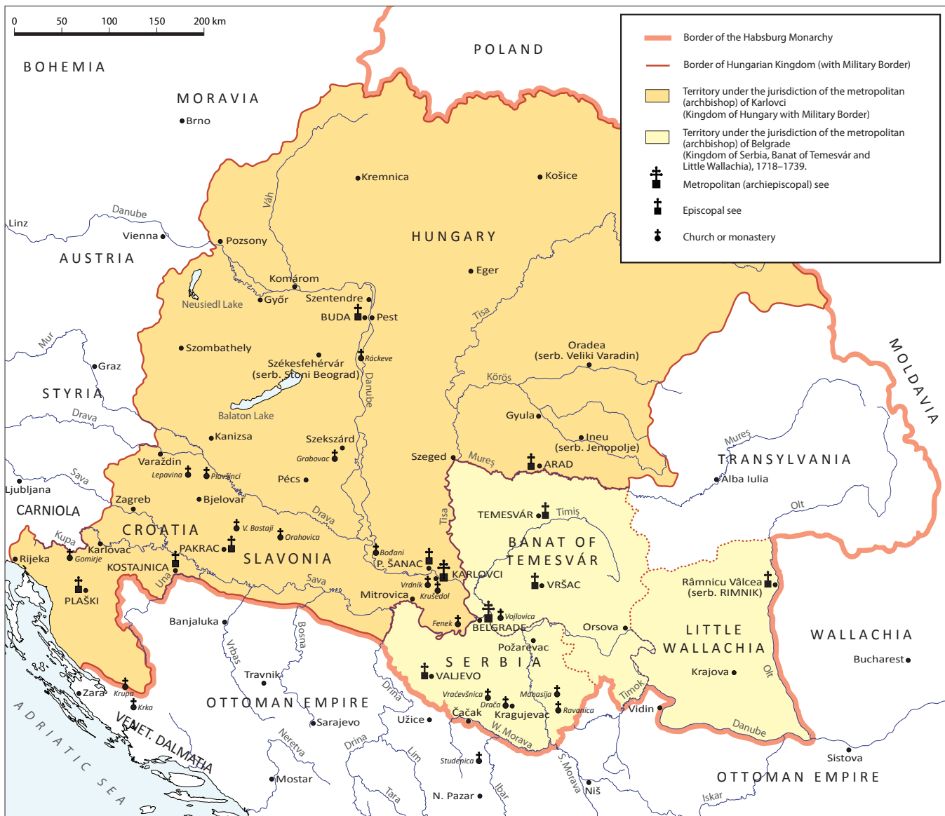
Map 1. Serbian Orthodox church in the Habsburg Monarchy, around 1730.