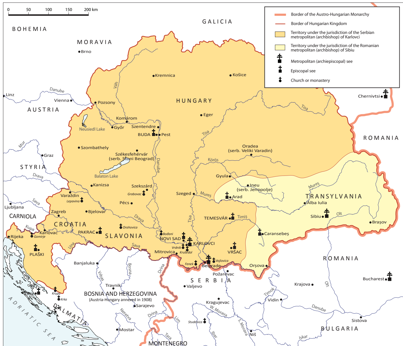
Map 2. Serbian and Rumanian Orthodox Churches in the Kingdom of Hungary, around 1910