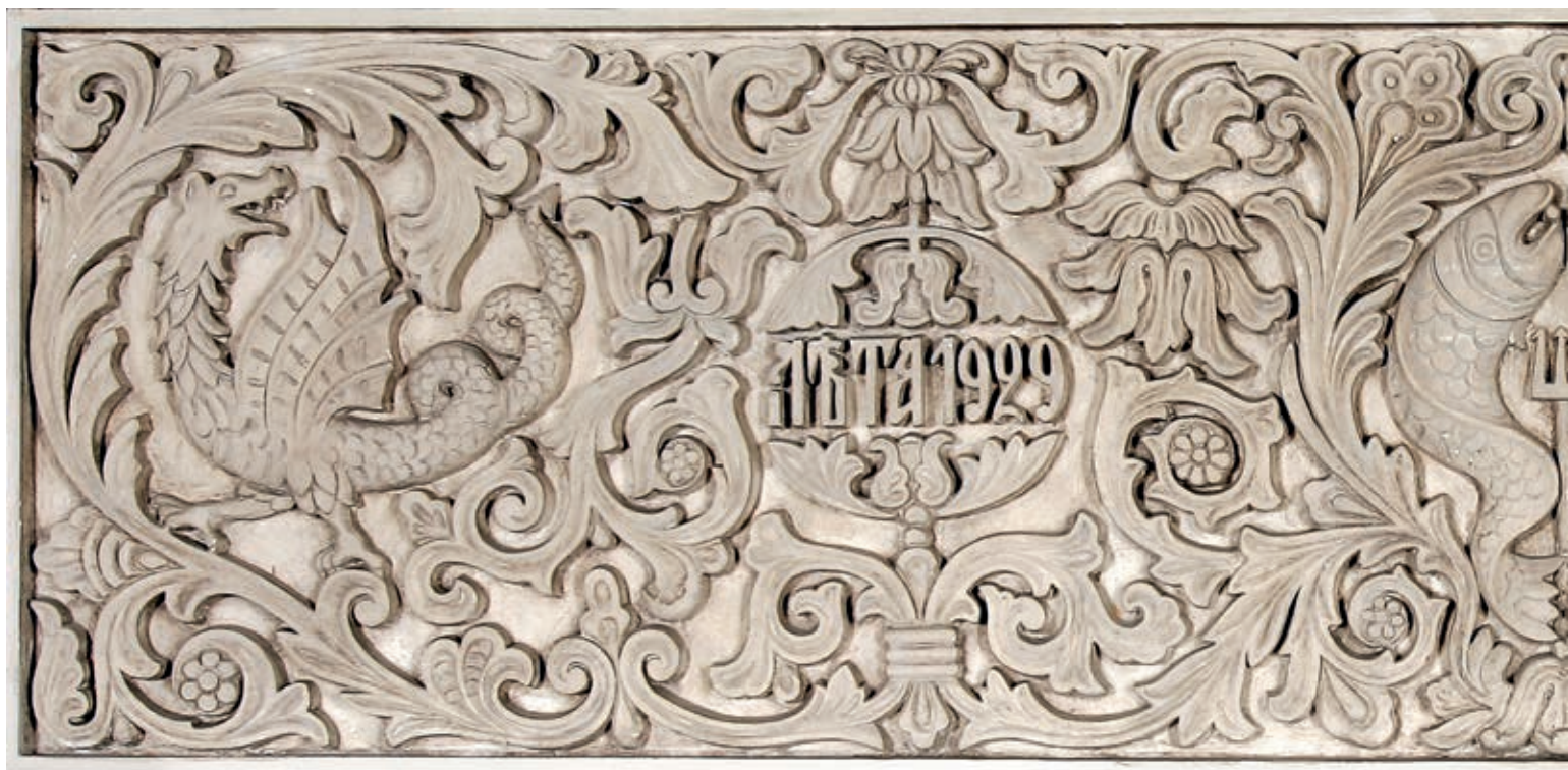
Fig. 92. Parapet of a hall in the basement of the Royal Palace, Belgrade 1929

national style founded on the restoration of the medieval Serbo-Byzantine tradition that was in harmony with the broader ideological and cultural movements prevailing in Europe at the turn of the centuries. 21 This artistic return to the past through a reinterpretation of the grandiose oeuvre produced during the Middle Ages gave rise to an authentic architectural work of strong tectonics, construction logic and vivid ornaments aiming at reflecting the stability and vitality of the nation and inducing strong dynastic and patriotic sentiments.