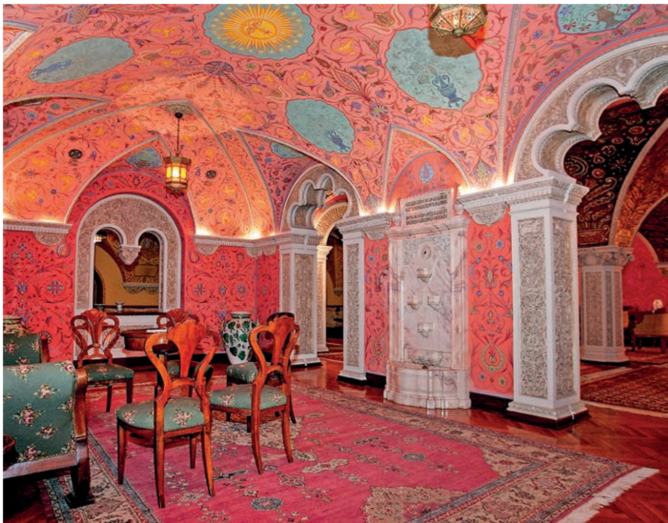
Fig. 93. Interior of the basement hall in the Royal Palace, Belgrade, 1924–1929

to cope with cultural and ethnic differences in the vast territory that he ruled over and whose politics was marked by a synergy of the eastern and western worlds. 25 A special place within the framework of this ideological overlap is held by the decoration of one of the rooms in the basement of the Royal Palace. Its frescoed cartouches contain a series of verses from and illustrations of the well-known epic poem in the pre-Kosovo cycle, Ženidba cara Dušana (The Marriage of Emperor Dušan) (fig. 93, 94), in which imperial power over South Slavic territories from the Adriatic coast to