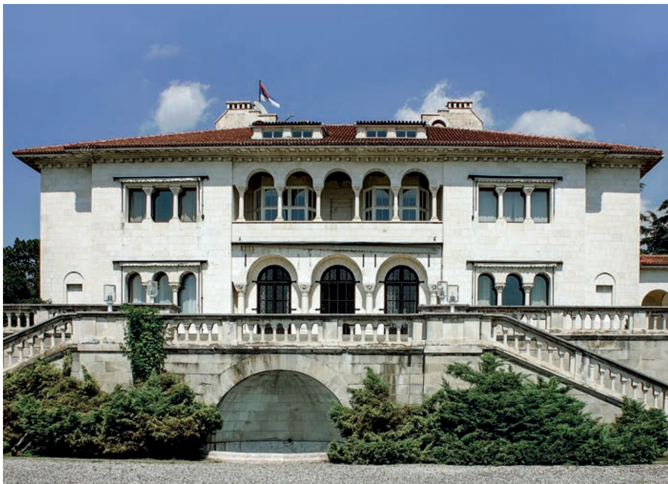
Fig. 88. The Royal Palace, Belgrade, 1924–1929.

the remainder in exchange for some of the royal estates in Belgrade and Serbia.