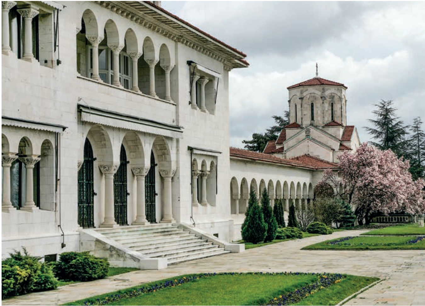
Fig. 89. The Royal Palace and the palace chapel of the Holy Apostle Andrew the First-called, Belgrade, 1924–1929

integrative matrix for overcoming differences and underpinning the idea of closeness among the South Slavic peoples was found in the rich stock of medieval art. We shall concentrate on only one segment of this multitude of multi-layered interventions that created a convincingly tangible image of a mythic past and a desired future through a revitalisation of the medieval heritage.