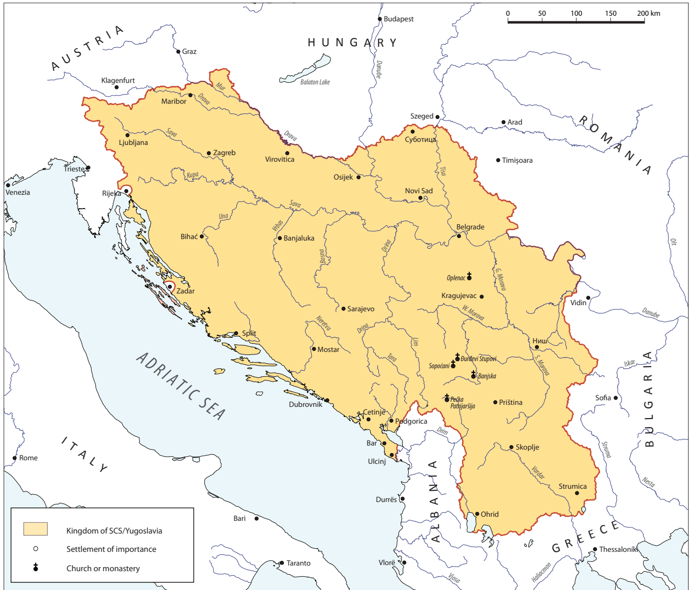
Map 4. Kingdom of the Serbs, Croats and Slovenes/Yugoslavia (1918–1945)