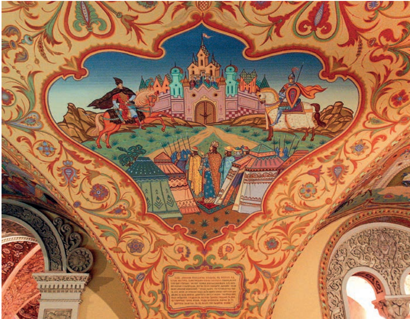
Fig. 94. Scene from the cycle The Wedding of Tsar Dušan , basement of the Royal Palace, Belgrade, Belgrade, by around 1929

workshops, which distributed such artworks throughout the Mediterranean. 26 The smooth sides of the impostes serve to emphasise the frontal ornaments, most of which are leaf-shaped or floral, and, along with the two goblet motifs, contribute to a suggestive visualisation of heavenly bliss. The very architectural form of the secluded garden with a well in its centre corresponds to the sumptuous inner courtyards of ancient residences that provided peace and privacy for the residents. It was the atrium with a source of water in the form of a well or a fountain for ritual bathing in early Christian and