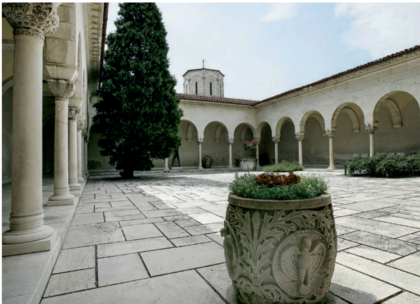
Fig. 90. Atrium of the Royal Palace, Belgrade, 1924–1929

supervisor of architectural work and thereafter librarian of the Royal Palace. 9 At the behest of King Alexander, he also headed a large archaeological expedition that conducted comprehensive field investigations and scholarly and exploratory trips to medieval churches and monasteries, during which, for political purposes, focus was placed on the regalia of medieval rulers. 10