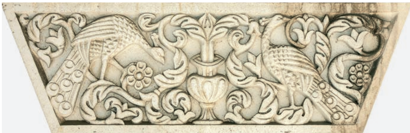
Fig. 91. Capital of a column, The Royal Palace, Belgrade, 1924–1929.

sign work lasted until 1934. 13 That the construction of the residence for the royal couple was a matter of state importance is indicated by the fact that the palace was consecrated in 1929, on the anniversary of the unification of the Kingdom of Yugoslavia, in the presence of the royal family. Once the flag was flown, the palace was declared the official residence of King Alexander and Queen Maria, which is also attested by an inscription carved on the parapet in one of the rooms in the basement (fig. 92). 14 When the royal family moved in, this marked the beginning of the active role the Dedinje palace would play as a promoter of the national idea and as an urban memorial site, a fact particularly highlighted by its frequent mention in the media of the time.