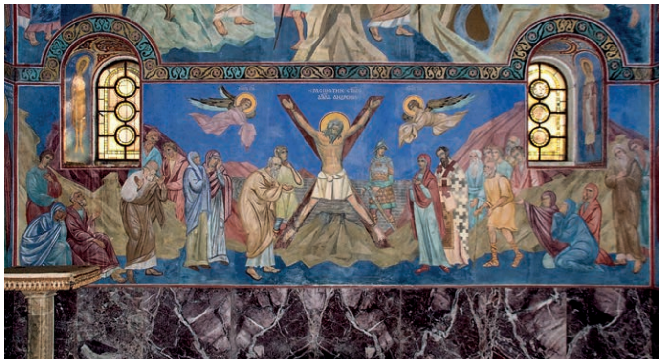
Fig. 95. Fresco on the southern wall of the palace chapel of the Holy Apostle Andrew the First-called, Royal Palace complex, Belgrade, around 1934

individuals in Antiquity and the Mediterranean region, but also a sacred tree of the Balkan Slavs. Through the cypresses planted by Saint Sava at Hilandar, the tree is linked with the offshoots of Serbian kings. It was by way of the Mediterranean that the identity of the lands that had recently been added to the Kingdom was being moulded as heirs to Antiquity, classical tradition, Byzantine legacy and imperial structure of governance. 28 Huge ensembles of monuments were erected throughout the Mediterranean during the reign of Justinian, with San Vitale in Ravenna and the Euphrasian Basilica in Poreč featuring similar forms of the highly developed type of atrium with characteristic perforated capitals. 29 Thus, visual means were used to underscore the idea of common cultural continuity and the natural right to re -unification, whilst the idea of authority was transposed outside the strictly national context of only one constitutive entity, whose tradition was adopted as state-building.