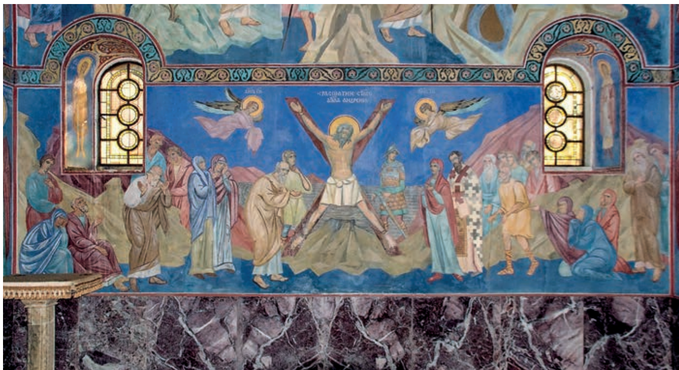
Сл. 95. Живопис јужног зида придворне капеле Светог Апостола Андреје Првозваног, Краљевски дворски комплекс, Београд, око 1934.

тет новоприпојених простора Краљевине као баштиника антике, класичне традиције, византијског наслеђа и империјалне владарске структуре. 28 Велики споменички ансамбли Јустинијанове епохе подизани су широм Медитерана, а Сан Витале у Равени и Еуфразијева базилика у Поречу поседују сличне форме развијених типова атријума са карактеристичним рупичастим капителима. 29 На овај начин је визуелним средствима подвлачена идеја о заједничком културном континуитету и природном праву на йоновно уједињење, а идеја власти транспонована изван уско националног контекста само једне конститутивне јединице, чија је традиција узета за државотворну.