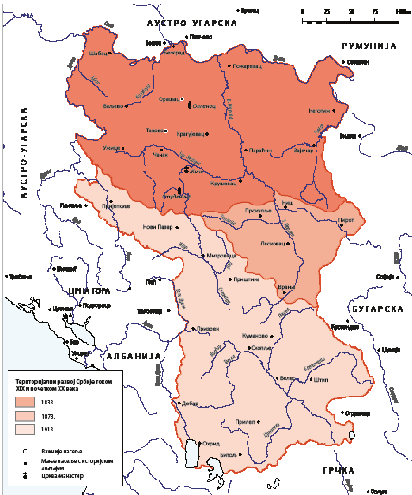
Карта 3. Територијални развој Србије током XIX и почетком XX века