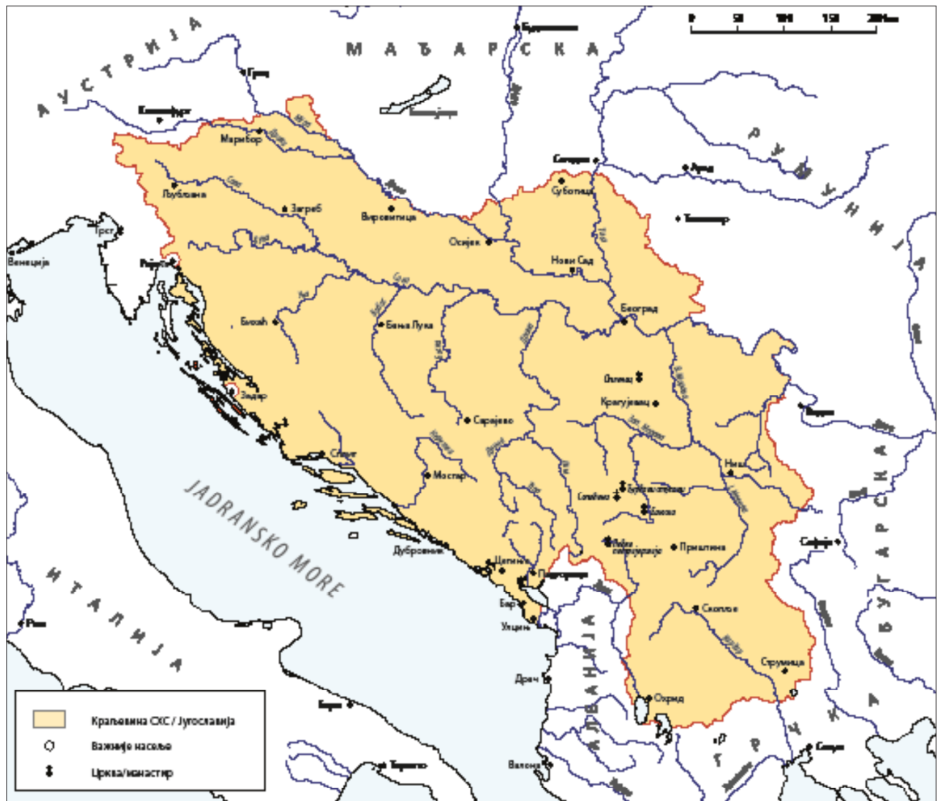
Карта 4. Краљевина СХС/Југославија (1918–1945)