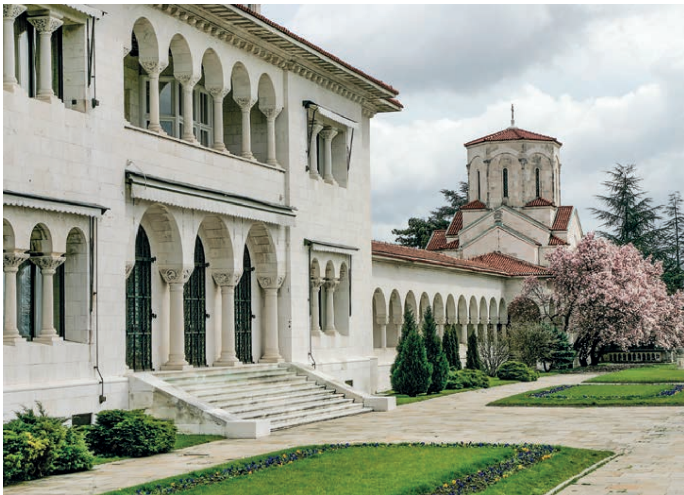
Сл. 89. Краљевски двор и придворна капела Светог Андреје Првозваног, Београд, 1924–1929.

цивилизацијским вредностима, интегративна матрица за превазилажење различитости и поткрепљење идеје блискости јужнословенских народа нађена је у богатом фондусу средњовековне уметности. Нашу пажњу посветићемо једном делу тог мноштва вишеслојних интервенција којима је посредством ревитализације средњовековног наслеђа створена уверљиво опипљива слика митске прошлости и жељене будућности.