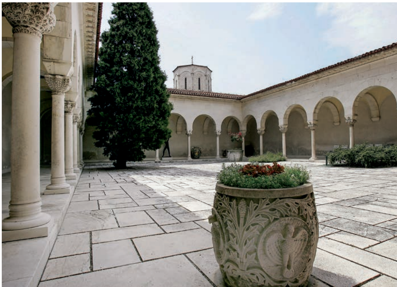
Сл. 90. Атријум Краљевског двора, Београд, 1924–1929.