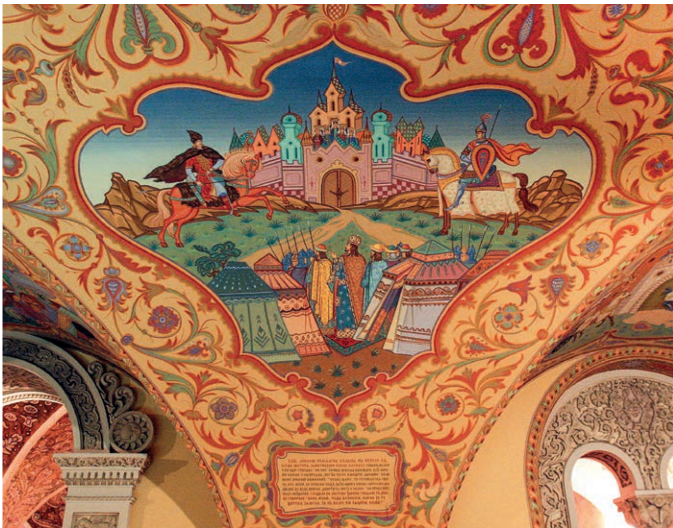
Сл. 94. Сцене из циклуса Женидба цара Душана , сутерен Краљевског двора, Београд, до 1929.

мотива пехара доприносе сугестивној визуелизацији рајског блаженства. И сама архитектонска форма интимне баште са бунаром у средишту кореспондира с репрезентативним унутрашњим двориштима античких резиденција, која су обезбеђивала мир и интиму укућана. У оквирима ранохришћанских и византијских базилика, али и каснијим клаустрима средњовековних самостана, управо је атријум, уз присуство воде у виду кладенца или чесме за ритуално купање, алудирао на блаженства рајског врта са извором живота. 27