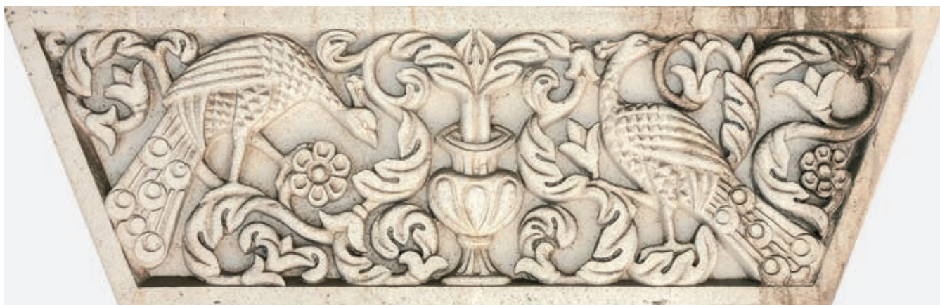
Сл. 91. Капител стуба, Краљевски двор, Београд, 1924–1929.

Изградња Краљевског двора са дворском капелом и пратећим објектима трајала је у континуитету између 1924. и 1929. године (сл. 89). 12 Радови на ентеријеру су потрајали до 1934. године. 13 Да је посао изградње резиденције краљевског пара било питање од државне важности указује и чињеница да је двор освештан 1929. године на годишњицу уједињења Краљевине Југославије у присуству краљевске породице, а постављањем заставе произведен у званичну резиденцију краља Александра и краљице Марије, о чему сведочи и натпис уклесан на парапету у једној од просторија сутерена (сл. 92). 14 Усељењем породице отпочиње активна улога двора на Дедињу као промотера националне идеје и урбаног топоса колективног памћења, што је посебно било подстицањем њеним честим присуством у ондашњим медијима.