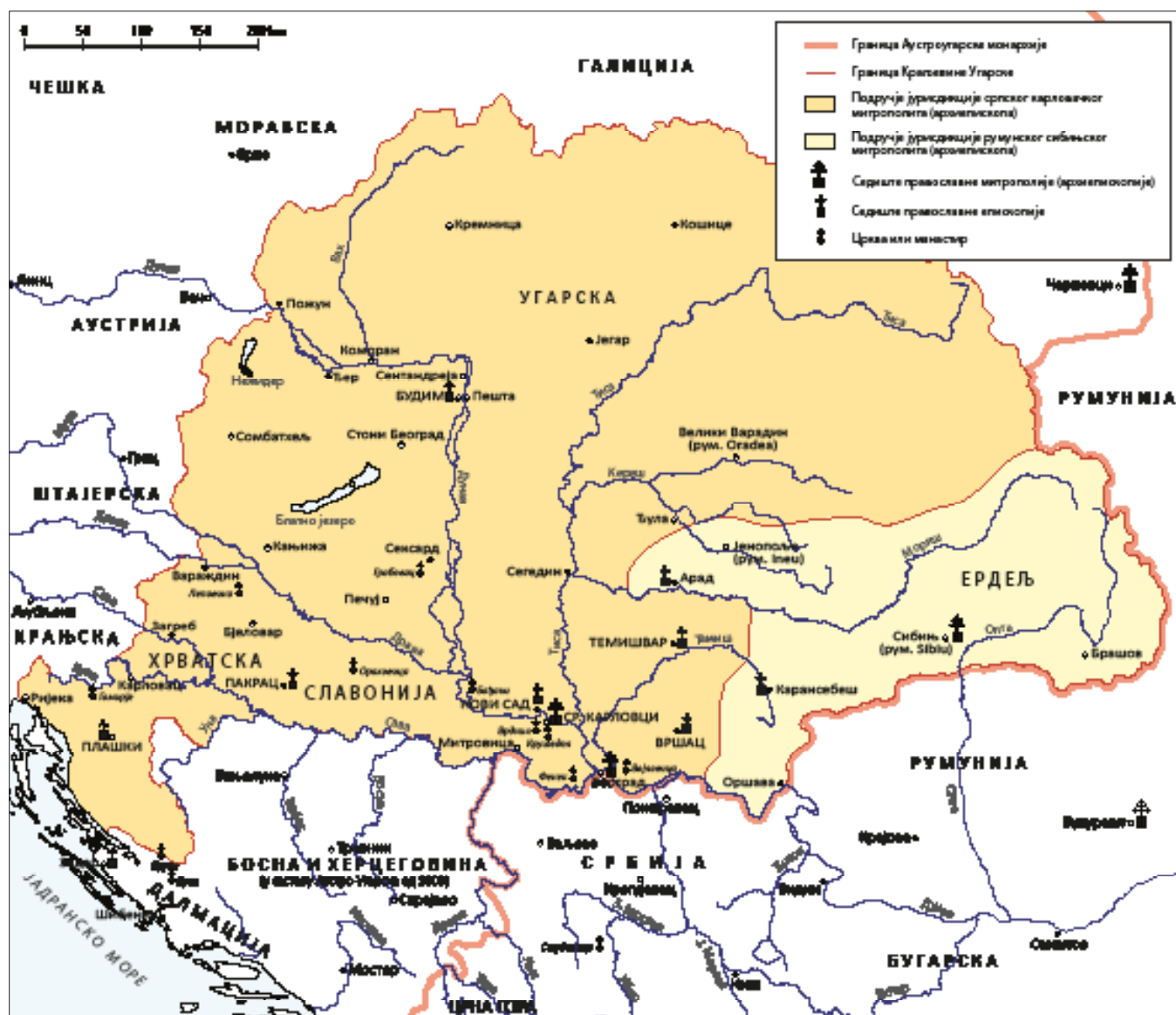
Карта 2. Српска и румунска православна црква у Краљевини Угарској око 1910. године