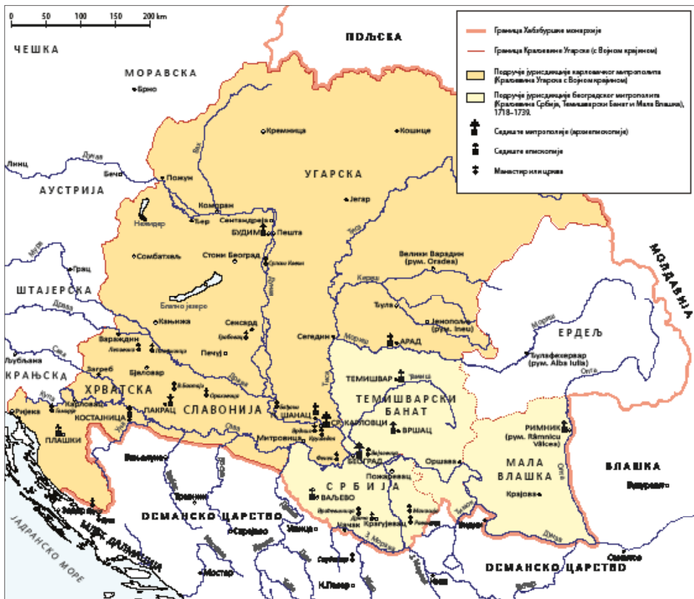
Карта 1. Српска православна црква у Хабзбуршкој монархији око 1730. године