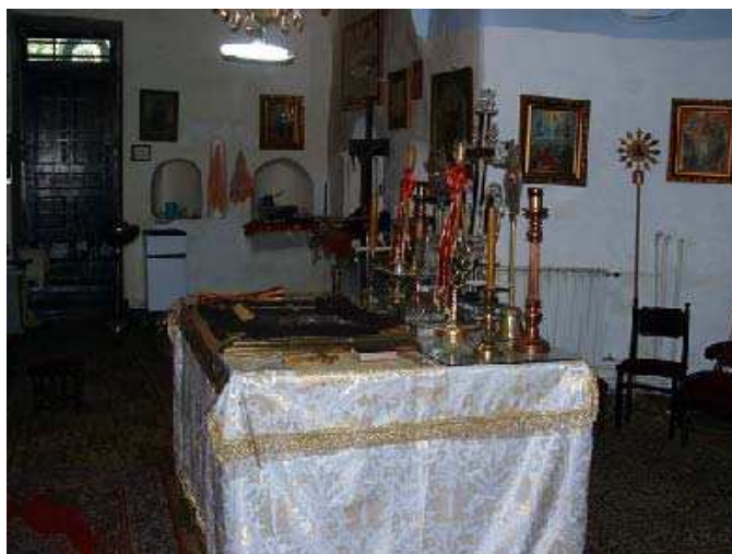
Sl. 6. Олтарски простор Fig. 6. Sanctuary

корпус подведен под заједничку кровну конструкцију. На крову су, са северне и јужне стране, отворена по два прозорска отвора, а са западне само један већи.