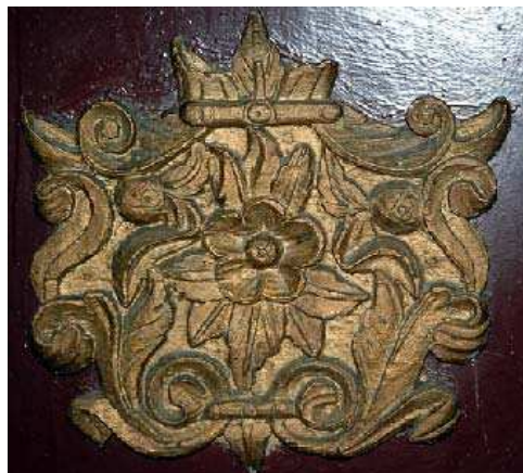
Sl. 8. Детаљ са иконостаса Fig. 8. A detail of the iconostasis