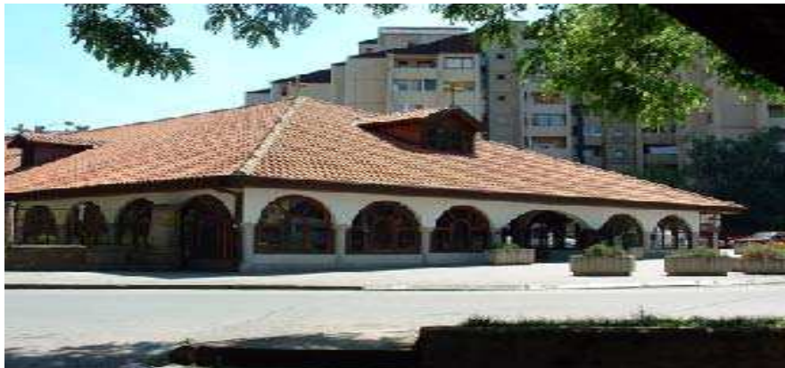
Sl. 1. Храм Св. Арханђела Михаила и Гаврила у Нишу, поглед са северозапада Fig. 1. Church of Holy Archangels Michael and Gabriel in Niš, the northwestern view

Отоманска империја контролисала просторе Јужне и Југоисточне Србије. Строгим нормама о подизању хришћанских светилишта, турске власти су онемогућавале хришћанском живљу да подиже цркве које би својим урбанистичким значајем, архитектонском обрадом и висином парирале џамијама.