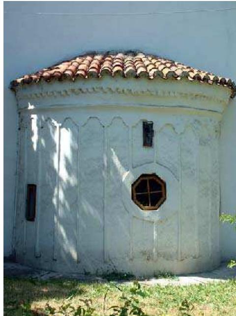
Sl. 4. Главна апсида Fig. 4. The principal apsis

У осовини главног брода се налази главна апсида, изнутра полукружна, а споља тринаестострана . (сл. 4) Странице апсиде су декорисане плитким пиластрима повезаних низом слепих аркадица, карактеристичним елементима византијске декорације. Апсида