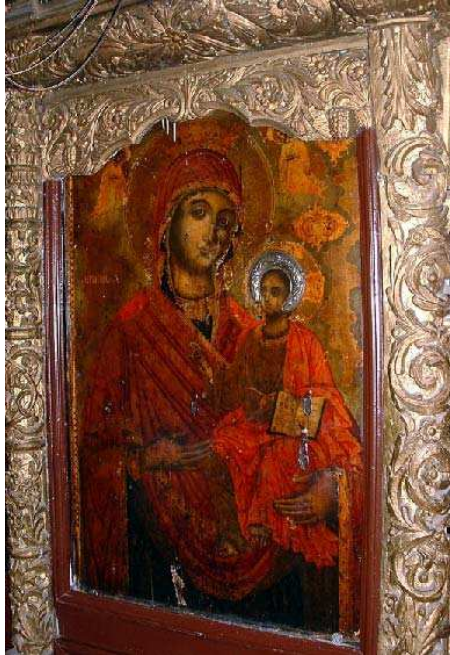
Sl. 10. Престона икона Богородице са Христом Fig. 10. The throne icon of the Virgin Mary Eleousa