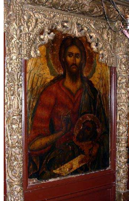
Sl. 11. Престона икона Св. Јована Крститеља Fig. 11. The throne icon of St John the Baptist

недовољне истражености, сазнања о карактеристикама, вредностима и думетима ове архитектуре била су веома скромна. Неправедно упоређене са градитељским корпусом епохе просперитета, ове грађевине, које су, услед финансијске оскудице и константних опструкција завојевача, биле лишене архитектонских декоративних егзибиција, једнострано су и погрешно оцењене као уметнички неуспеле. Несумњиво је да се у ограниченим и спутаним градитељским условима не могу очекивати водеће идејне и уметничке појаве, али су управо овакве грађевине, преносећи у упрошћеном виду основне просторне и конструктивне концепције византијског градитељства, биле главни носиоци идеје трајања средњовековне архитектуре византијских духовних основа. Мали нишки саборни храм, својим конструктивним склопом, припада једном веома раширеном, специфичном изданку поствизантијске архитектуре, великој скупини грађевина које су подизане на широком простору Балкана, од Епира, Македоније, Јужне Србије и Бугарске. Елементи ове архитектуре уочавају се најпре у базиликалној просторној организацији, опточавању главног корпуса грађевине спољним тремовима, обликовању олтарских апсида и примени низа детаља секундарне декоративне пластике. Храм Св. Арханђела у Нишу јесте лишен сликовитости и упечатљивости, али не и саме суштине његовог постојања. Житељи Ниша начинили су мудар избор; жртвујући форму они су успели да врате у живот духовно