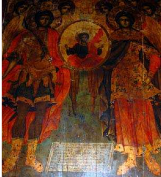
Sl. 2. Икона Сабор Св. Архангела, са записом о времену подизања храма Fig. 2. The icon „Synaxis of Holy Archangels“, containing the note on the Church construction date

готово да није ни било, јер је отворено свега неколико изузетно малих прозора. 9 Прелиминарна археолошка истраживања показују велики степен вероватноће да је Мали нишки саборни храм подигнут на старијем култном месту. 10