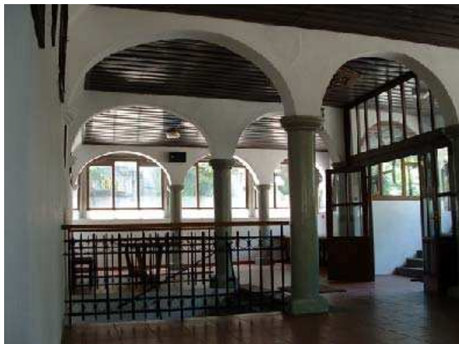
Sl. 5. Егзонартекс Fig. 5. Exonarthex