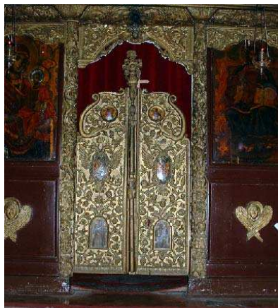
Sl. 7. Царске двери Fig. 7. Royal Gates