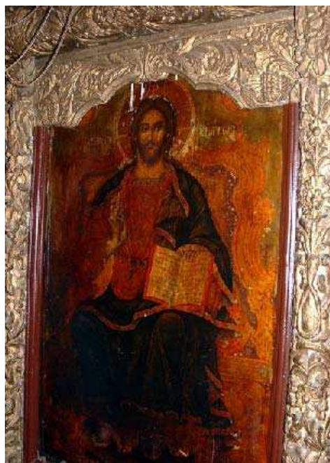
Sl. 9. Престона икона Исуса Христа Fig. 9. The throne icon of Jesus Christ

срећу се и на Хиландарским иконостасима, што сведочи да је чак и у ова тешка времена постојала жива уметничка размена и одашиљање утицаја са Свете Горе, стожера православног Хришћанства. 19