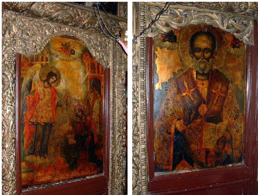
Sl. 12. Престона икона Благовештења Fig. 12. The throne icon of the Annunciation