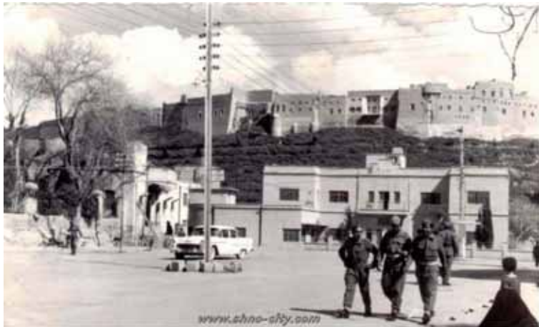
وینهیهکی سالی به نجایهکان له شاری ههلاو مناره ههولیری پایتهخت (ههر حکیمی)

موسیکاکان بهدی دهکری و ئه مرۆ ئه وهست و سۆزهیه پیی دهوتری مۆرکی رهسه نایهتی، جا به گویرهی ئه و تویرینه وهیه بیت ئه و دهشتی ههولیر دهوله مهنترین ناوچهیه له کوردستان له و رهسه نایهتیه چونکه کۆنترین شوینه له رۆژه لاتی ناوه راست که مروق کشتوکالی تیا کردوووه